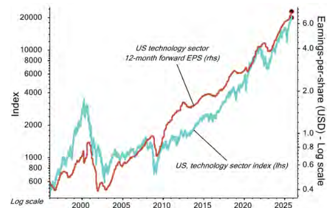
Chart 1: US-Technologiesektor und Gewinne.

finanzieren lässt. Dennoch bleibt die Begründung für weitere Investitionen klar: Die bestehende Infrastruktur reicht bei weitem nicht aus, um die prognostizierte Nachfrage zu decken. Fest steht: Der Einfluss der sogenannten „Magnificent Seven“ Tech-Giganten war noch nie so groß, und ihre strategischen Entscheidungen prägen zunehmend sowohl die Marktstimmung als auch die Kapitalströme.