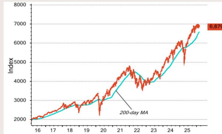
Chart 2: S&P 500 Index.

Rohstoffrends und Sektorrotationen deutliche Zugewinne im Technologie- und Rohstoffsektor verzeichnete. Singapurs Markt setzte seinen stetigen Aufwärtstrend fort, wobei große Bankaktien den STI wiederholt auf neue Rekordhochs trieben und die robuste Finanzstärke des Stadtstaats unterstrichen. Indien hingegen blieb deutlich zurück: Sowohl der Nifty als auch der Sensex fielen um mehr als 5 %, da globale Investoren Kapital abzogen – ausgelöst durch schwächere Wachstumssignale und das Ausbleiben eines Handelsabkommens mit den USA. Insgesamt hob die Performance der Region die divergierenden nationalen Entwicklungen hervor: starke, technologiegetriebene Zuversicht in Nordasien im Gegensatz zu vorsichtiger, politikgeprägter Marktstimmung in Indien.